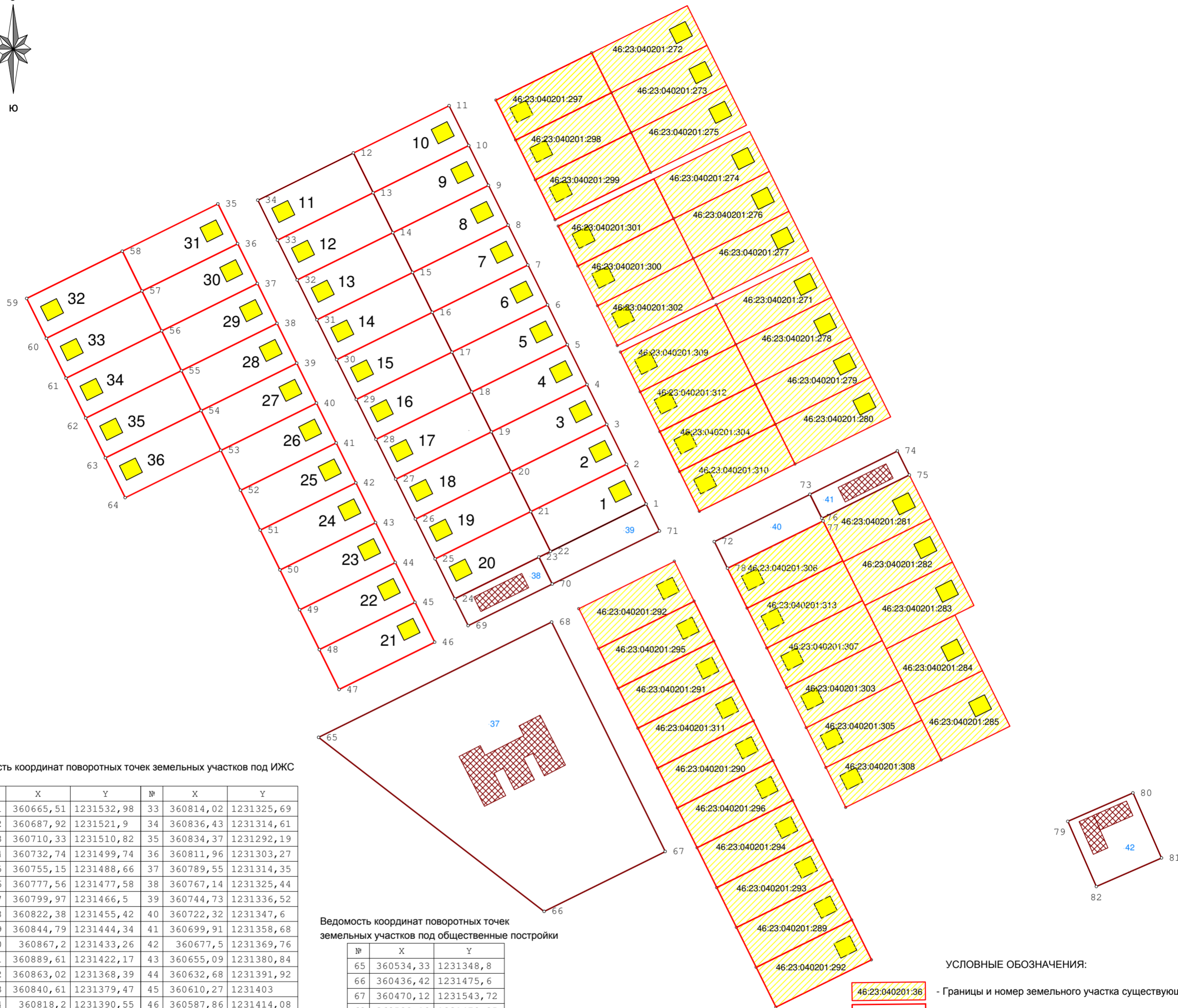
Ведомость координат поворотных точек земельных участков под ИЖС